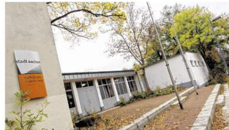
Ab 2014/15 sollen die Türen dicht gemacht werden: Der Schulstandort Barbarastraße wird zur Disposition gestellt.

Einen weiteren „Spezialfall“ machen die Planer erwartungsgemäß im äußersten Nordwesten der Stadt aus. Die Katholische Grundschule Horbach verzeichnet nämlich lediglich 15 Neuanmeldungen. Der Standort soll getreu dem Motto „Kurze Beine – kurze Wege“ dennoch vorerst erhalten bleiben – allerdings wird empfohlen, die KGS ab dem übernächsten Schuljahr als Teil der Grundschule Richterich fortzuführen.